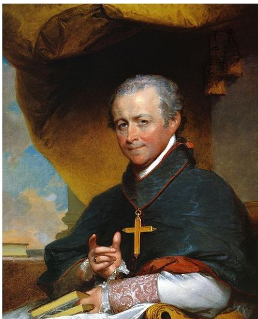
Monseigneur de Cheverus

Répondant à une requête de l'évêque de Montauban, l'État rachète l'ancien couvent pour y loger maintenant le grand séminaire diocésain. Le rétablissement du diocèse, annoncé par le décret impérial de 1808 créant le département du Tarn-et-Garonne, était devenu effectif seulement en 1823, sous la Restauration. L'année suivante, le nouvel évêque, Monseigneur de Cheverus, montait sur le siège épiscopal, et son premier souci fut la remise en marche des grands rouages du diocèse, à commencer par la formation des futurs prêtres. Dans le cadre de la Contre-Réforme, un premier séminaire confié aux Lazaristes, avait été ouvert à Montauban en 1660 à l'extrémité du faubourg du Moustier, sur l'emplacement de l'évêché actuel. Mais en 1792, ses bâtiments, classés parmi les biens nationaux, furent vendus aux enchères, puis démolis.